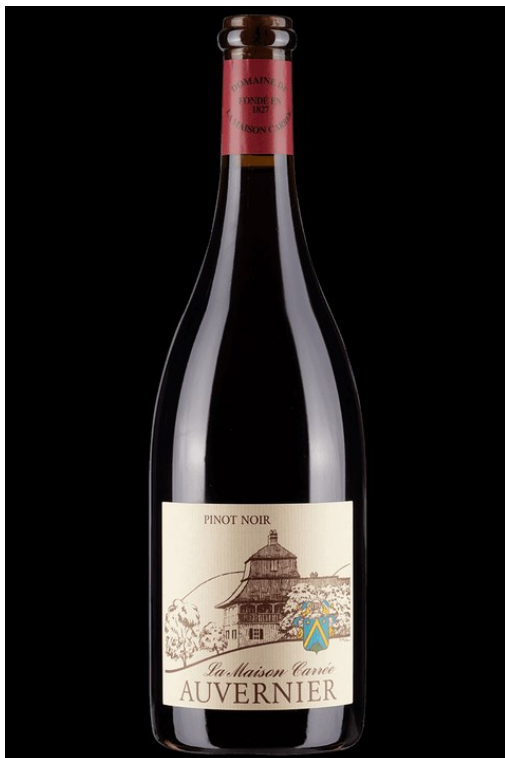
Pinot noir Auvernier 2021, Alexandre Perrochet, Domaine de la Maison Carrée, Neuenburg, 32 Franken; lamaisoncarree.ch.