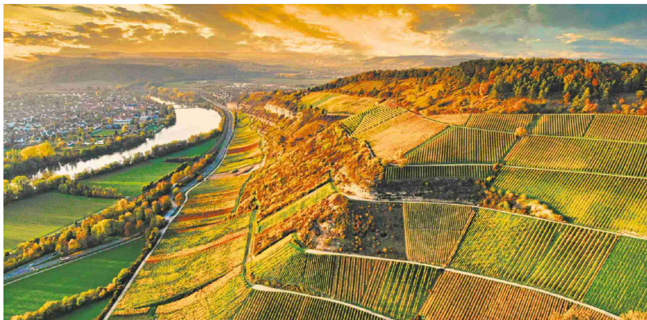
Die Rebstöcke des Benediktusbergs, der zum biozertifizierten Weingut Rudolf May im deutschen Anbaugebiet Franken gehört, sind bis zu 30 Jahre alt.

Die Branche scheint innovativ, dynamisch und mutig zu sein wie nie zuvor. Die Jungen scheuen sich nicht, neue Wege zu gehen und die bereits hohe Qualität weiter zu steigern.